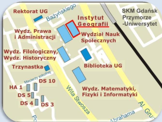
UNIwersytet Gdański Instytut Geografii – Gdansk, ul. Bażyńskiego 4