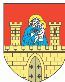
Urząd Miasta i Gminy we Fromborku