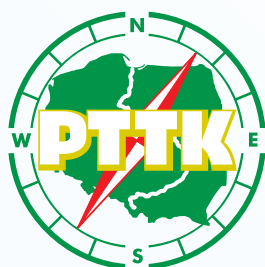
Polskie Towarzystwo Turystyczno-Krajoznawcze Oddział Ziemi Elbląskiej w Elblągu