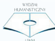
Wydział Humanistyczny Uniwersytetu Warmińsko-Mazurskiego w Olsztynie