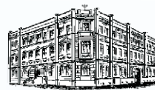
Ośrodek Badań Naukowych im. Wojciecha Kętrzyńskiego w Olsztynie