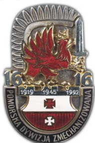
im. Króla Kazimierza Jagiellończyka